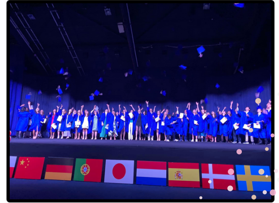
Photos de Section Américaine-Auditorium Pyramides

Nous sommes reconnaissants de votre soutien continu et nous avons hâte de partager ensemble cette journée spéciale qui marque le début de nouveaux horizons pour nos étudiants.