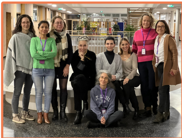
Quelques-uns de vos représentants APELI au CA

Vos parents représentants de l'APELI étaient présents aux deux réunions du Conseil d'Administration du Lycée International tenues en novembre.