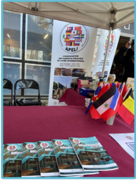
Stand APELI Marché de Noël

Le samedi 2 décembre, l'APELI était présente au Marché de Noël organisé par le Club International. Nous étions là pour offrir à nos adhérents une boisson chaude avec un petit gâteau. Merci à tous ceux qui ont participé!